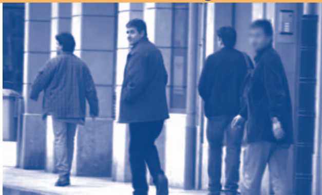
Voces sin libertad