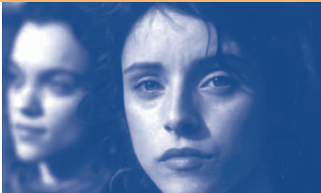
El viaje de Arián