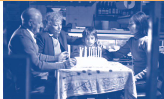
Episodio de Daniel Burman